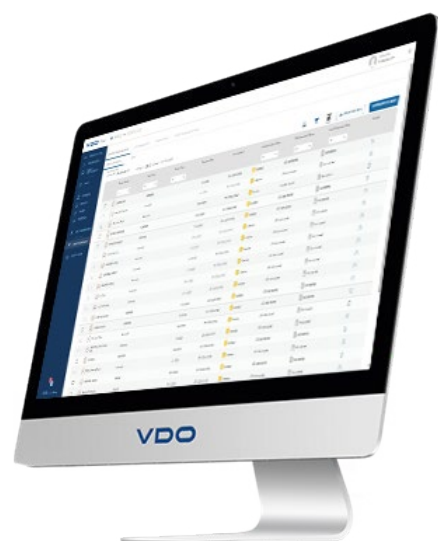
VDO Fleet Remote Download